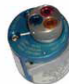
Turret for Pneumatic Crimp Tool Type "A"