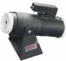
Pneumatic Crimp Tool Type "B"

Please consult our sales department for other contact options or crimp tooling details.