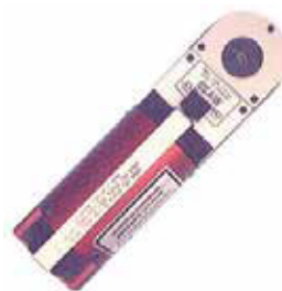
Pneumatic Crimp Tool Type "A"