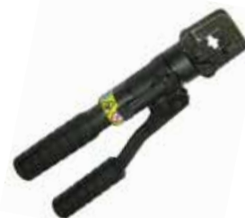
Oleodinamic Crimp Tool