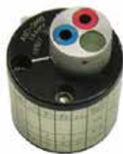
Turret for Manual Crimp Tool