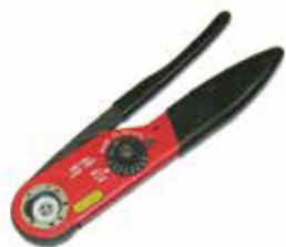
Manual Crimp Tool

Please consult our sales department for other contact options or crimp tooling details.